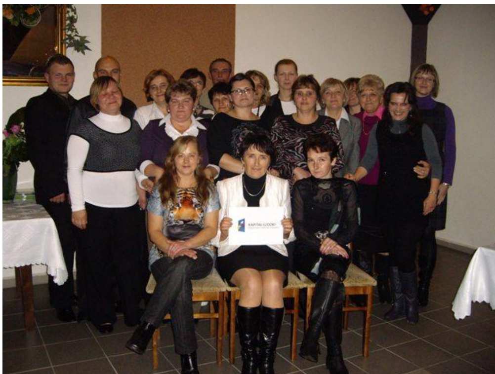
Pamiętkowe zdjęcie na zakończenie projektu.