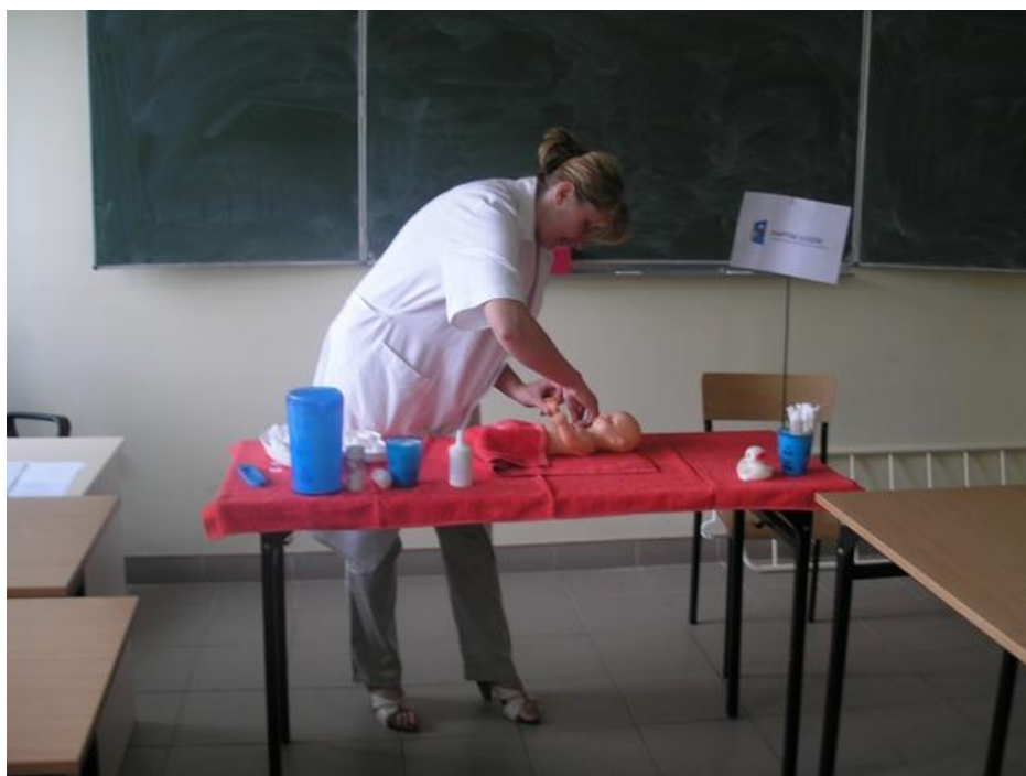
Kurs opieunki osób starszych, samotnych i dzieci

(przygotowała: Katarzyna Kulińska-Pluta)