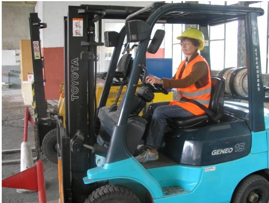
Praktyczna nauka jazdy na wózku widłowym.